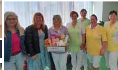
Tag der Pflege - im Alten- u. Pflegeheim mit „Nervennahrung“ um „Hinzuhören“ - wir kämpfen für Verbesserung der Arbeitsbedingungen & sagen DANKE für eure ARBEIT.