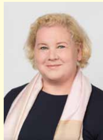
Bundesministerium für Arbeit, Soziales, Gesundheit, Pflege und Konsumentenschutz: Korinna Schumann (SP) | Bild: Philipp Simonis

Zusammengefasst betont Schumann, dass es nicht nur darum geht, das Regelpensionsalter zu erhöhen, sondern ein umfassendes Maßnahmenpaket zu schnüren, das die Menschen dabei unterstützt, länger und gesund im Erwerbsleben zu bleiben. Dies würde nicht nur das System stärken, sondern auch den Einzelnen zugutekommen, indem sie mehr finanzielle Sicherheit haben.