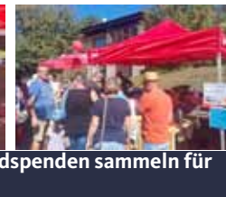
...am Bergerkirtag Geldspenden sammeln für guten Zweck