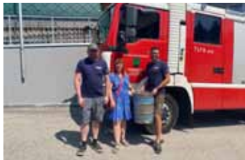
Ein Fassbier für die Freiwillige Feuerwehr Perwölfling als DANKE an alle ehrenamtlichen Feuerwehrmänner & Feuerwehrfrauen!