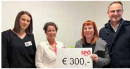
...Benefizpunsch der SPÖ Bezirks-Frauen für das Frauennetzwerk Rohrbach