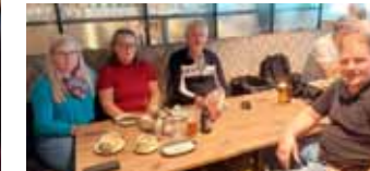
...unterwegs & anschließende „Nachbesprechung“