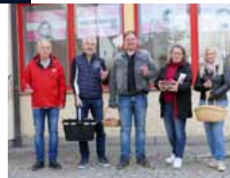
...unterwegs mit frohe Osterwünschen & Eiern