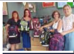
Schultaschen-Sammelaktion! Schultaschen an Familien übergeben, die es nicht so leicht haben