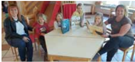
...unterwegs in den Kindergärten - Bücher für unsere Rohrbach-Berger Kinder zum Welttag des Buches vorbeigebracht