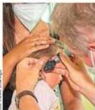
Flüssigkeit im Mittelohr kann das Hörvermögen mindern.