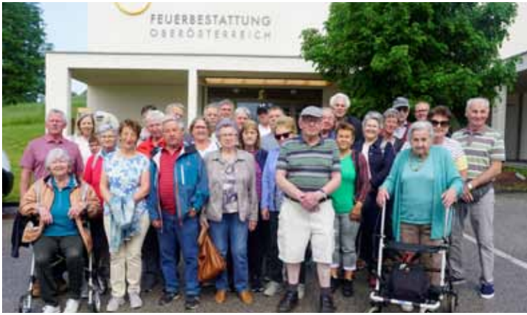
Besuch des Krematoriums

Liebe Leserinnen und Leser, das waren natürlich nicht alle unserer Veranstaltungen und Ausflüge. Ich hoffe ihr seid etwas neugierig geworden und schaut euch diesen Verein einmal als Mitglied an. Ihr könnt im Jahr 2024 kostenlos Mitglied sein. Unser Angebot lautet: Freunden Freude schenken